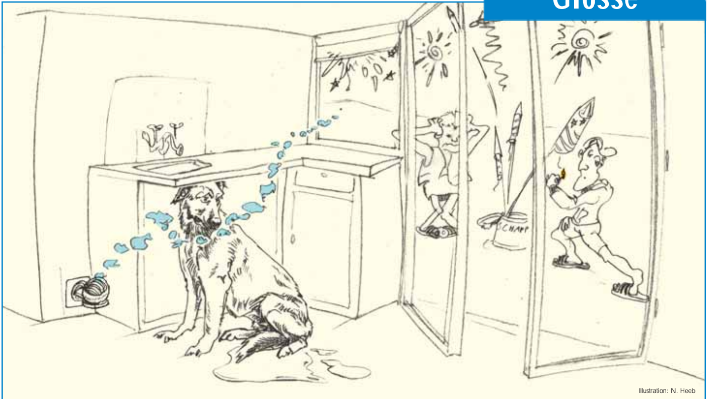
Illustration: N. Heeb