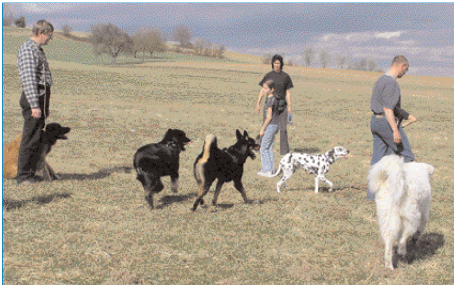
Freies Bewegen unter Artgenossen schafft eine wichtige Voraussetzung für eine positive Verhaltensentwicklung.

Jemanden auf den Arm nehmen bedeutet umgangssprachlich, sich über jemanden lustig machen bzw. jemanden für nicht