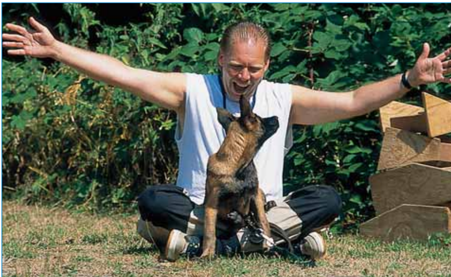
„Du bist der Grösste, das hast du super gemacht!“ Feiern Sie erwünschtes Verhalten mit Ihrem Hund und denken Sie daran: Die Körperhaltung spricht für sich!

Reagiert der Hund auf ein Hörzeichen regelmässig nicht wie gewünscht, liegt der Fehler womöglich in einer unpräzisen Konditionierung. Die Belohnung wurde da etwa mit einer anderen Tätigkeit verknüpft oder auch zu schnell abgebaut. Damit wird auch klar, dass es nichts nutzt, wenn wir unseren Hund mit Worten überschwemmen, in der Meinung, es bleibe dann schon irgendwann etwas haften. Selbst eine energische Stimme ändert diesen Sachverhalt nicht. Jedes Hörzeichen muss einzeln konditioniert und in unterschiedlicher Umgebung aufgebaut und gefestigt werden. Das dazu passende – in der Glosse beschriebene – Beispiel einer