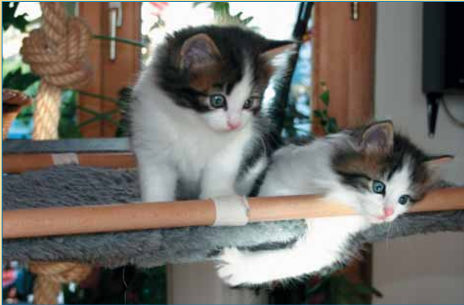
Auch Wohnungskatzen können ein tiergerechtes Leben führen: Dafür braucht es eine katzenge- rechte Wohnungsgestaltung und persönliches Engagement.

Aber, ein grosses ABER: Das Leben draussen ist sehr gefährlich! Vor allem im Strassenverkehr – nicht zuletzt in so genannten „ruhigen“ Wohnquartieren oder ländlichen Gegenden – sterben unzählige Katzen, darunter besonders viele Jungtiere, die oft nicht einmal das erste Lebensjahr erreichen. Wohnen Sie in einem Quartier von Rasern oder in der Nähe auch nur einer stark befahrenen Strasse, müssen Sie sich sehr gut überlegen, ob Sie Ihrer Katze überhaupt Freilauf ge- wahren wollen. Die idealste Variante und ein goldener Mittelweg ist ein katzensicher eingezäunter Garten – aber dafür muss man natürlich entsprechend wohnen.