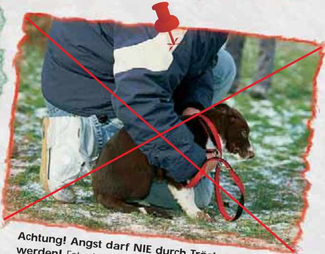
Achtung! Angst darf NIE durch Trösten belohnt werden! Foto: J. Giger

Ablenkung im gemeinsamen Spiel löst die ängstliche Stimmung. Foto: J. Giger