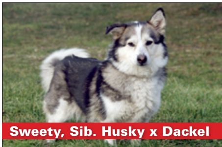
Sweety, Sib. Husky x Dackel

Der 6-jährige Dino ist eine starke Persönlichkeit, die mit Konsequenz und Einfühlungskraft geführt werden möchte. Dieser kastrierte Rüde ist kein Anfängerhund und wird nur als Einzelhund platziert. Wir suchen für Dino erfahrene Hundehalter, die ihm eine Chance geben, sich wieder in ein neues Zuhause einzugliedern.