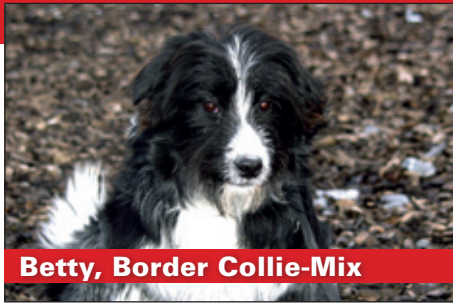
Betty, Border Collie-Mix

Anmerkung zu Honey und Spike: Aufgrund der Rassenzugehörigkeit bestehen in einigen Kantonen spezielle Auflagen für Hunde dieser Rasse. Bitte informieren Sie sich vorab in Ihrem Wohnkanton über die gesetzlichen Bestimmungen zur Haltung dieser Hunde. Im Internet unter www.tierimrecht.org unter «Hunde-Recht» finden Sie die nötigen Informationen.