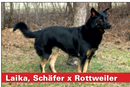
Laika, Schäfer x Rottweiler

Sweety ist eine süsse 10-jährige Hündin, die viel Humor mitbringt. Sie ist eine gute Mäusejägerin und kann sich heute noch für «Ball spielen» begeistern. Aufgrund ihres langen Rückens sollte sie nicht täglich Treppen steigen müssen. Sie hat bis jetzt keine Rückenprobleme. Für die kastrierte Hündin suchen wir Menschen mit einem ruhigeren Haushalt ohne Kleinkinder und Katzen.